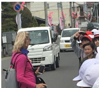
↑「Hello」と英語で話し掛けました。