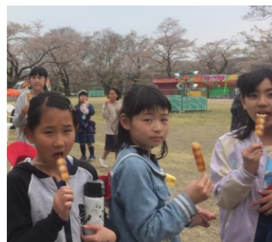
↑やっぱり花見には、お団子です。

今年も、高学年児童は、桜の花が満開の館山や白石川の土手に花見に行ってきました。外国人の方と出会い、外国語活動で学んだ「Hello」「Welcome to Shibata！」と英語で話し掛けること、そして柴田町の名所を知るところを目的としています。